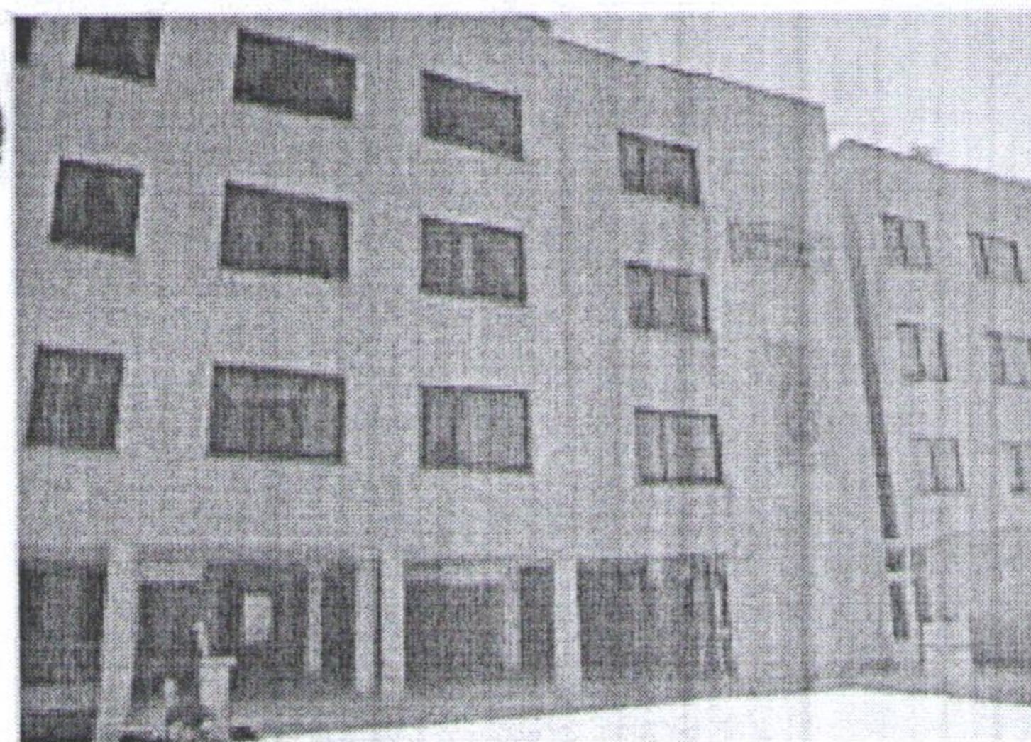
مجتمع خوابگاهی مرحوم ناظران